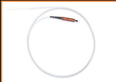
Deutsche Radial-Faser, 400µm und 600µm