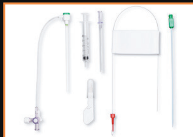
Faser-Einführset für Radialfasern