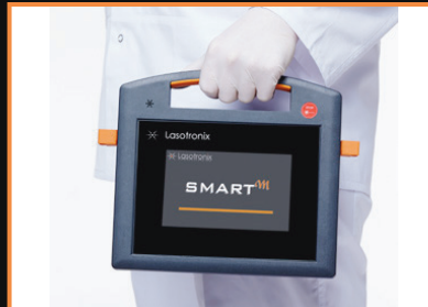
Leicht und tragbar (2.5 kg)